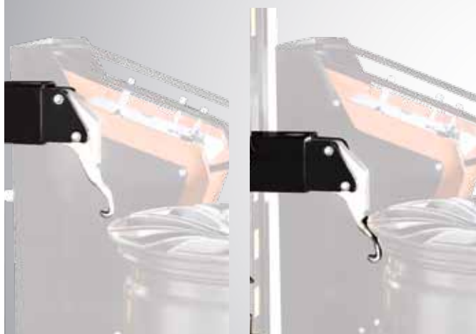
Estrazione del tallone leverless