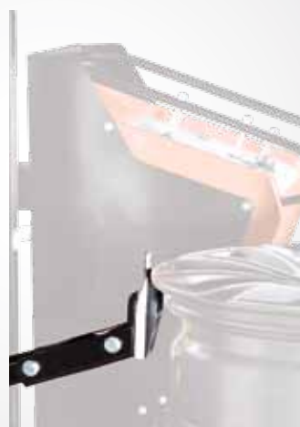
Utensile di montaggio tallone inferiore